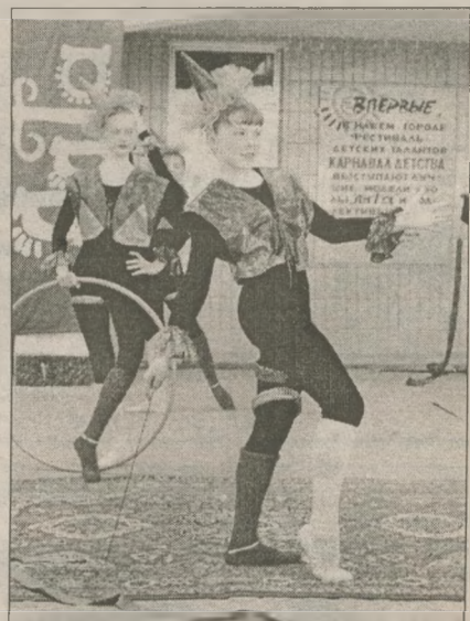
Черниговская цирковая студия «Скоморохи» успешно выступила на празднике