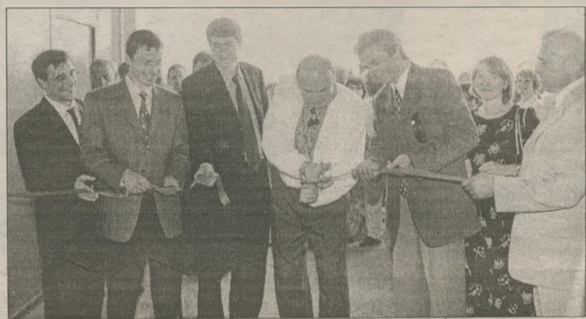
Символическое разрезание ленточки на входе во вторую очередь «Кронпака». Отныне славутичские кроненпробки изготавливаются из материалов, произведенных в Славутиче: на предприятии второй очереди выпускаются заготовки для штамповки