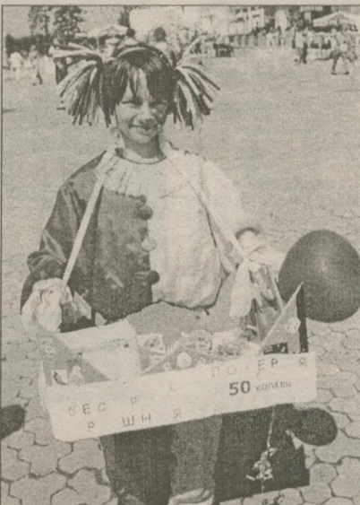
Праздник то и дело грозился превратиться в карнавал — к величайшему удовольствию всех его участников