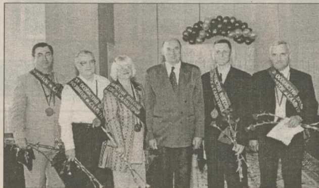
Шестеро славучан получили ленту особого отличия — «за весомый вклад в развитие города»