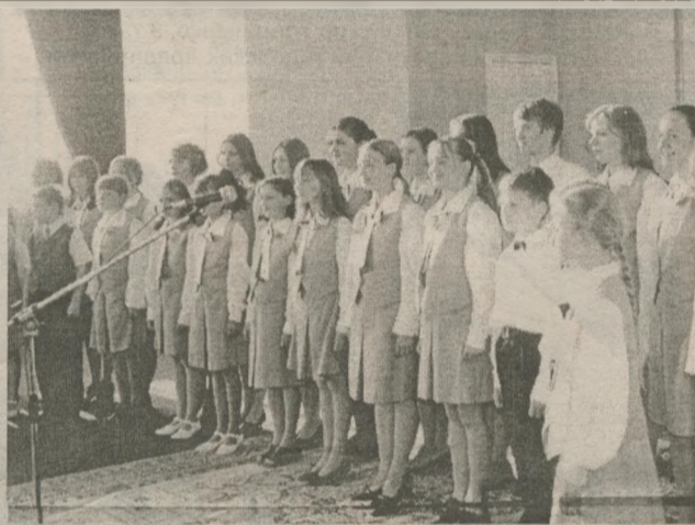
Гимном "Белый ангел Славутича" открыл 5 июня праздничный концерт, посвященный 16-й годовщине нашего города, хор Детской школы искусств