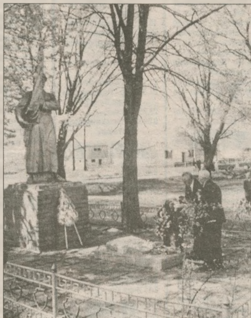
Комаровка. В четырех братских могилах села похоронено, по разным данным, от 1000 до 2000 погибших бойцов Советской Армии