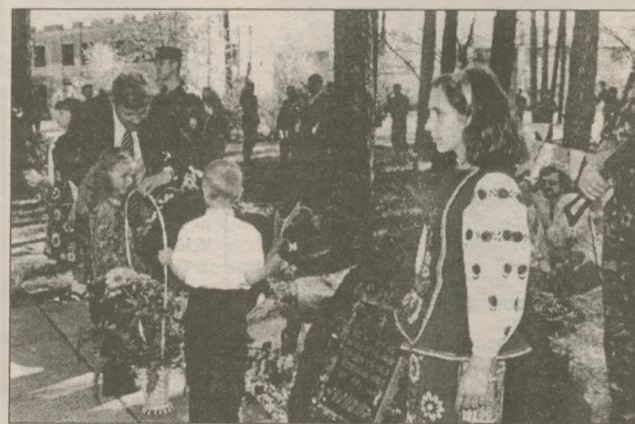
Ветераны и новоиспеченные "светлячки Славутича" возложили цветы к монументу ликвидаторам-чернобыльцам и памятного знаку "Героям Днепра"