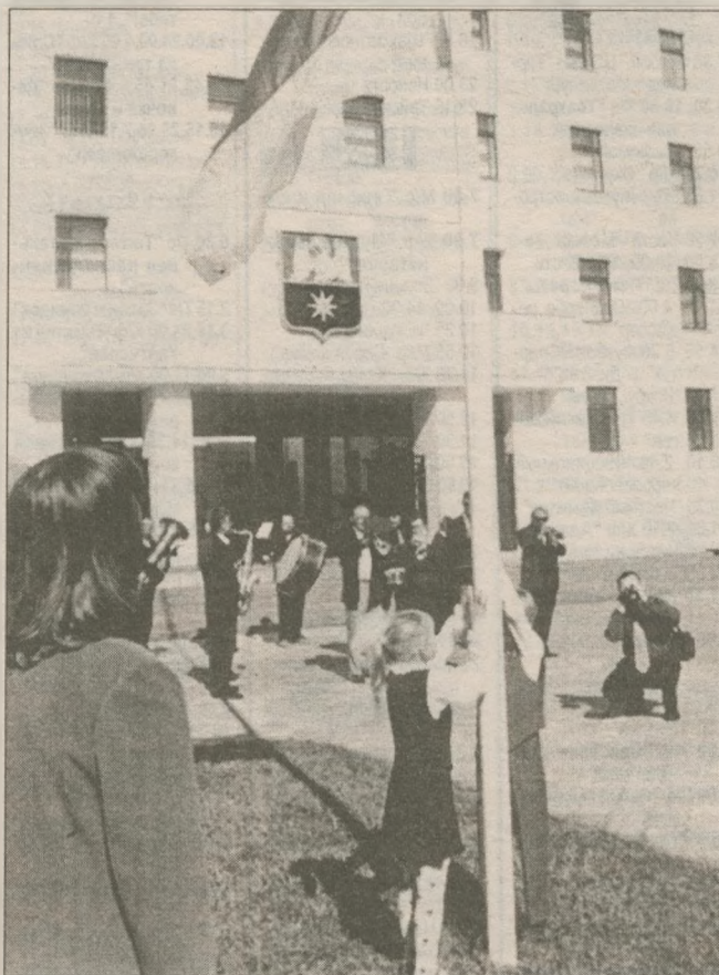
По традиции, лучшим ученикам было предоставлено право поднять флаги Украины и Славутича