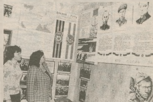
Мысы. В музее боевой славы. Его создали собственными усилиями энтузиасты из числа местных жителей. Уникальны экспонаты этого музея, в частности подлинные фото военных времен. Сегодня подобных музеев в Украине остались единицы, тогда как в конце восьмидесятых годов прошлого века их было несколько тысяч