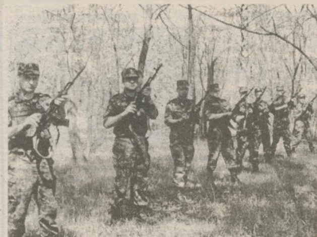
Салют прозвучал над братскими могилами в Мысах, Комаровке, Неданчицах, Червоний Гуте и Редьковке