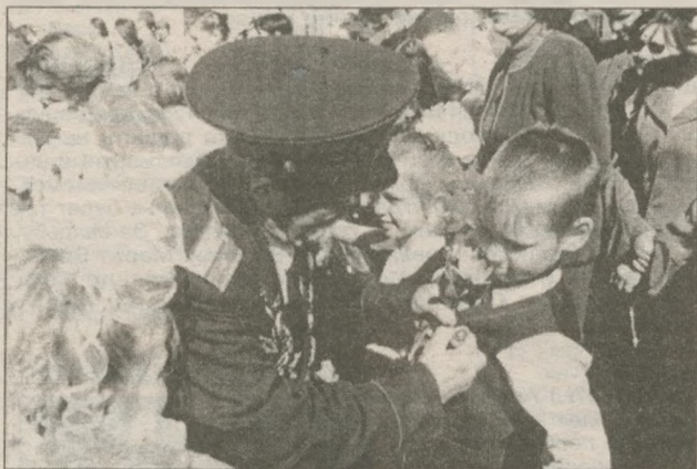
Посвящение в "светлячки Славутича". В ряды детской городской организации в нынешнем году влилось более 300 первоклашек