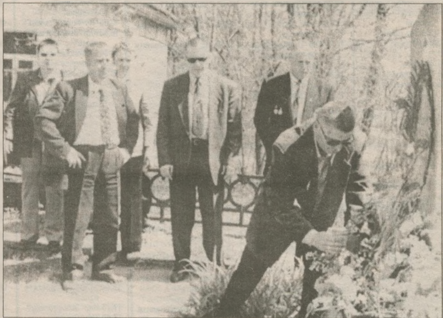
Воины-"афганцы" возложили венки и цветы к могилам героев, погибших в Великую Отечественную. Всего в Мысах, основной точке Днепропольского плацдарма, похоронено 8 Героев Советского Союза