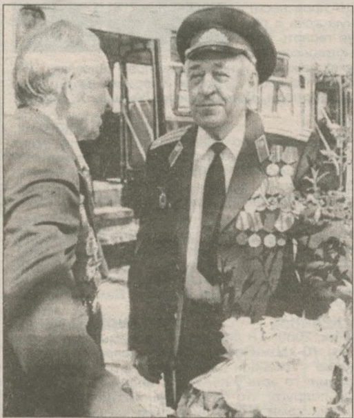
У ветеранов было о чем вспомнить. Но с каждым годом в Марше памяти их участвует все меньше — они болеют, дряхлеют и уходят из жизни. Все меньше тех, кто помнит войну, остается и в окрестных селах