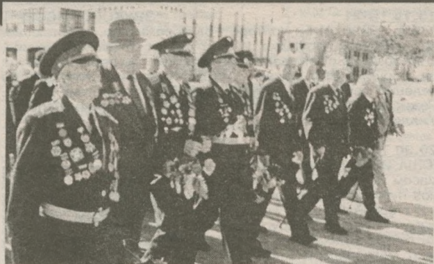
По случаю Дня Победы в городе состоялся парад, возглавляла который группа ветеранов. Приняли в нем участие и школьники младших классов, и молодежный горсовет, и представители общественных организаций