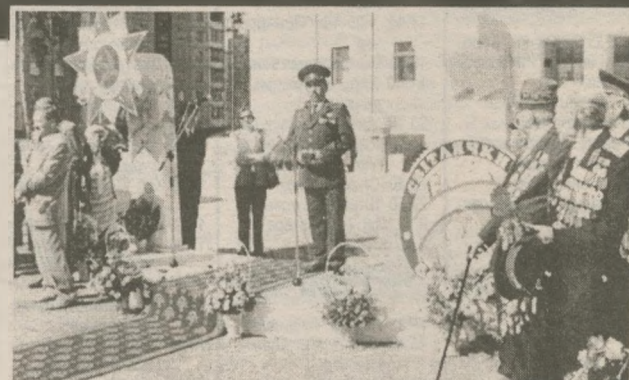
С приветственной речью к ветеранам, пришедшим на площадь, обратились военный комиссар Славутича, городской голова и генеральный директор ЧАЗС