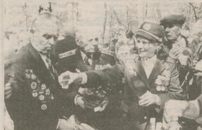
Фронтные сто граммов подняли ветераны и самоселы села Редьковка. Три живущие в селе семьи вновь встретили славутичский поезд хлебом-солью и немудреной закуской. В этот раз славутичане тоже прибыли на встречу не с пустыми руками. Редьковцы были счастливы. Как же немного надо нашему человеку для счастья!