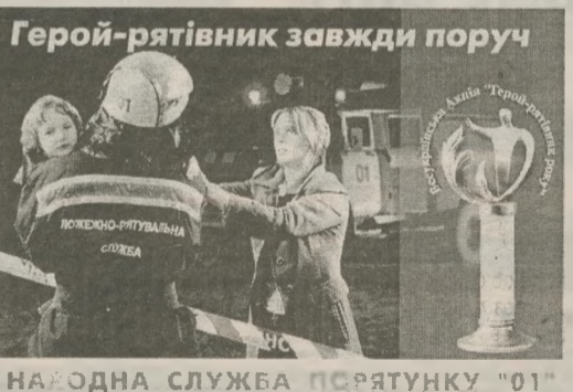
НАРОДНА СЛУЖБА ПОРЯТУНКУ "01"

Центр протипожежної пропаганди відділу пожежної безпеки в Чернігівській області Держпожбезпеки МНС України.