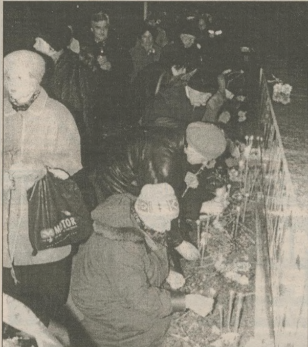
Гражданская панихида и возложение цветов к монументу Героям-ликвидаторам началась на час раньше, чем в предыдущие годы, — в 0 часов 23 минуты: именно в этот час (по действующему тогда московскому времени) произошел взрыв на четвертом блоке.

Семейный ансамбль "Фернандес" (глава ансамбля недавно приехал из США работать в проекте) поет для ликвидаторов по-английски