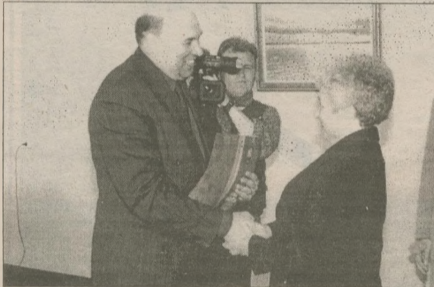
Подавляющее большинство ветеранов-чернобыльцев, приглашенных на торжественную встречу, посвященную 17-летию аварии на ЧАЭС, получили грамоты и благодарности от городского головы и администрации станции.

Отдать дань памяти, несмотря на ветер и мороз, пришли ветераны Чернобыля, члены профсоюза неработающих пенсионеров, администрация города и ЧАЭС, горожане