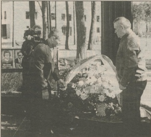
Ветераны Чернобыля возложили к монументу Славы корзину цветов — отныне этот ритуал станет частью новой традиции: встречи бывших работников, а ныне — пенсионеров ЧАЭС с руководством города и станции