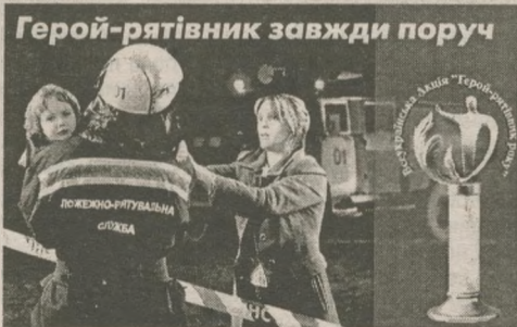
НАРОДНА СЛУЖБА ПОРЯТКУ "01"

Акція проводиться протягом року. Учасники, які стають лауреатами, нагороджуються відзнакою