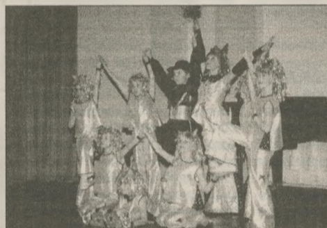
"Стара казка на новий лад" — хореографічна композиція. Керівник — Мошковська Л.Р.