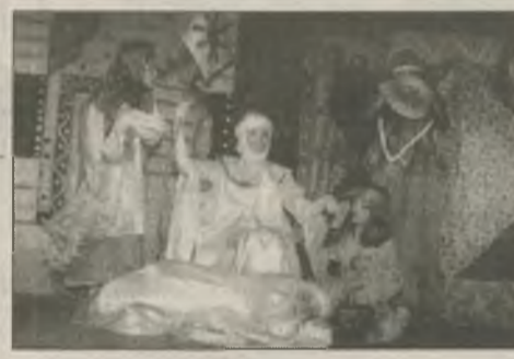
Сцена з вистави "Зачароване мишеня Фанні" за мотивами казки А.Балінт. Режисер-постановник — Дружкова Т.О.