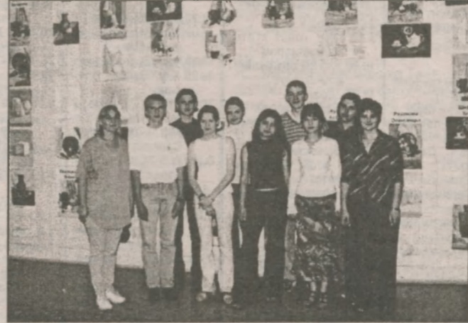
Учораšní абітурієнти успішно здали вступні екзамен з дизайну

Скоро розпочнеться другий навчальний рік майбутніх спеціалістів-дизайнерів Славутського представництва Інституту реклами. Підсумкова виставка-огляд практичних робіт студентів, що відбулася у фойє Дитячої школи мистецтв, співпала з ювілеєм міста. Вона стала одночасно і дарунком імениннику, і сенсацією, бо юні таланти представили глядачеві не тільки оригінальні навчальні роботи, але й виставку ювілейного плакату, присвяченого Славутичу. Що ж це за Інститут реклами? Яких спеціалістів він готує? Який рейтинг серед вищих навчальних закладів він посідає в Україні? Чому саме в Славутичі відкрито філію інституту? Ці та інші запитання законірно виникають у славутчан при першому знайомстві з інститутом. Своєю освітньою діяльністю інститут розпочав в перші роки незалежності, а невдовзі був признаний "Відкриттям року в освіті". Таку високу оцінку дав йому Міжнародний відкритий рейтинг популярності "Золота фортуна" за професійну рекламну освіту, побудовану на ґрунті новаторських і класичних освітніх технологій. Не зрікаючись напрацьованих підходів у освіті, інститут при підготовці спеціалістів приділяє пріоритетну увагу трьом основним сучасним напрямкам: засвоєння комп'ютерних технологій, без знання яких не можливий сучасний професіонал; знання європейських іноземних мов, що дає вихід на іноземних партнерів та відкриває інші позитивні можливості; володіння рекламно-менеджерськими і маркетинговими технологіями, що дає можливість вірно побудувати рекламу, отри-