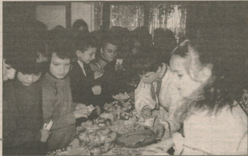
"Торговля" идет полным ходом