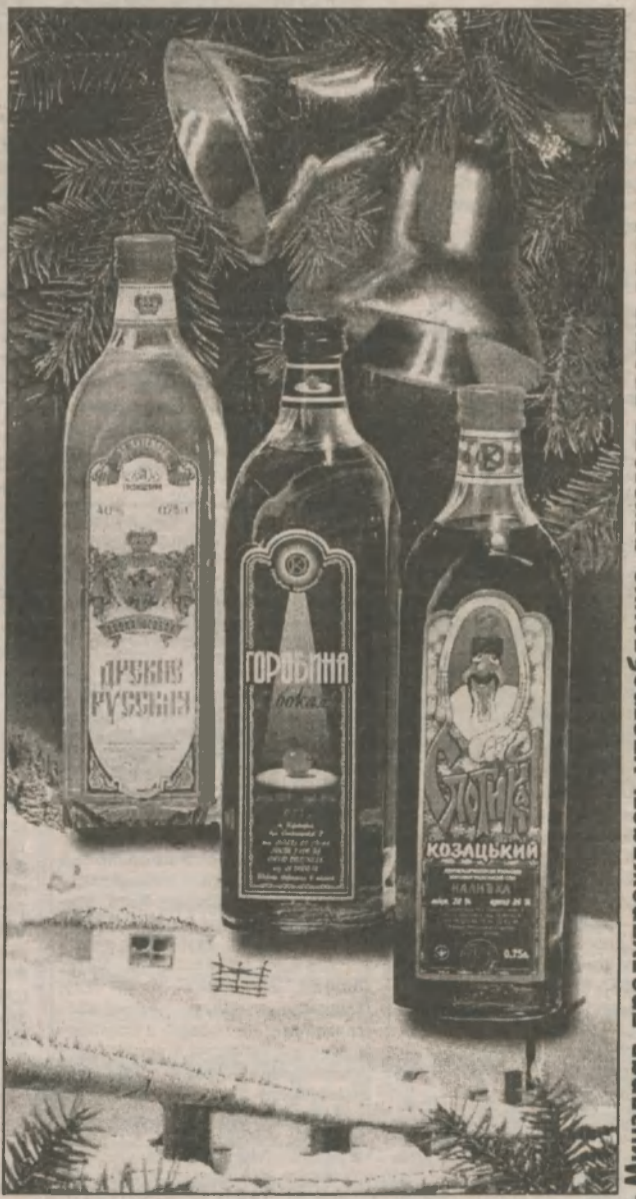
Минздрав предупреждает: употребление алкоголя вредит вашему здоровью

Ліц. № 000592, серії АО Комітет України з монополій на виробництво та обіг спирту, алкогольних напоїв та тютюнових виробів от 22 липня 1999 року.