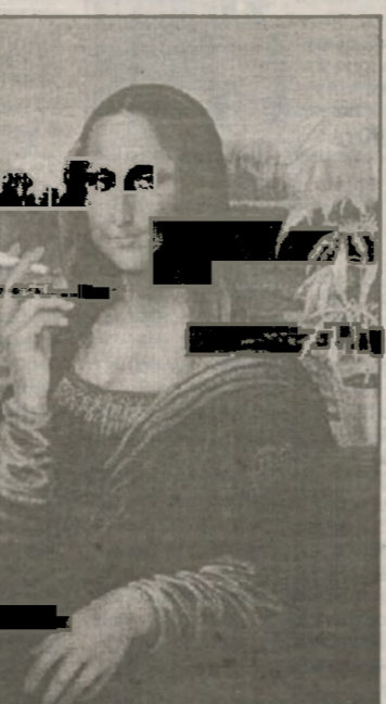
Загадочная улыбка тоже повод для беспокойства

наркоман испытывает повышенную тревогу, его мучает ломота в костях, частые ознобы с холодной испариной, бессонница, иногда психозы. Чрезмерное потребление снотворных средств (алениум, реланиум, раведорм и целый ряд других препаратов) ведет к ослаблению мыслительных способностей, нарушению координации движений, речевой функции. Такое состояние может продолжаться 3—4 часа, после чего наступает вялость, тяжелый сон с храпом. В результате — мрачное состояние, раздражительность, головная боль, плохое настроение. У пристрастившихся к психостимуляторам (к ним относятся эфедрин, кокаин, экстази и др.) отмечается повышенная оживленность, импульсивность, эйфория и слишком быстрая речь. Их также выдает дурной запах изо рта и покраснение кожи. Если же вы обнаружите у ребенка буйство, непредсказуемые поступки, мышечную оцепенелость, «провалы» памяти, «уход в прошлое» — подросток пристрастился к веществам из группы галлюциногенов. Среди подростков достаточно распространена так называемая токсикомания, т. е. пристрастие к вдыханию паров бензина, ацетона, клея «Момент». После «принятия» такого вещества подростки склонны к скандалам, дракам. Физическое проявление — налитые кровью глаза, частое