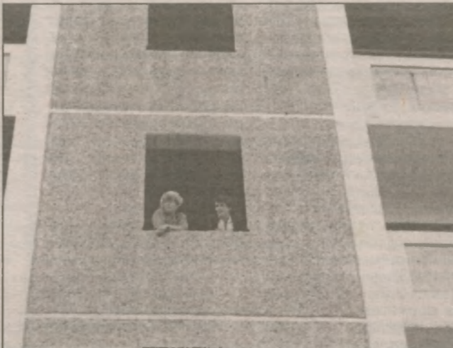
По словам мэра, работы ведутся ударными темпами, люди работают с утра до ночи. "Нам не стыдно перед людьми — мы платим им вовремя зарплату", — подчеркнул мэр