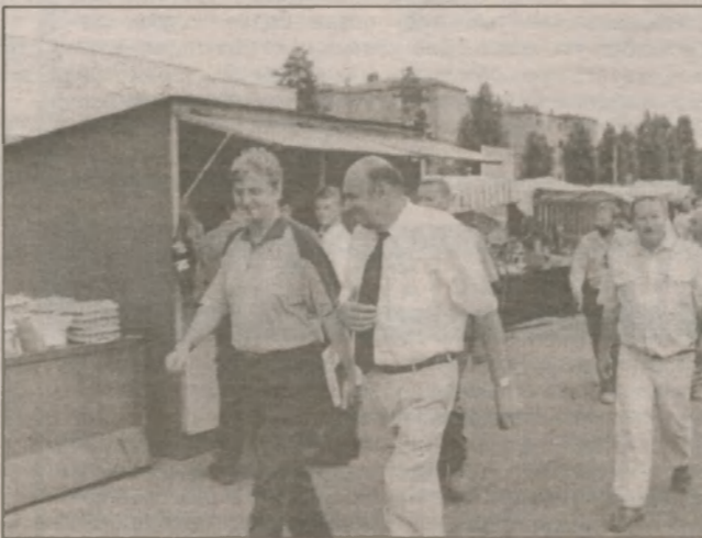
Городской рынок работает до позднего вечера. Мэр поинтересовался ценами на продукты питания и особенно на арбузы, которые в больших количествах завезли в город из Астрахани