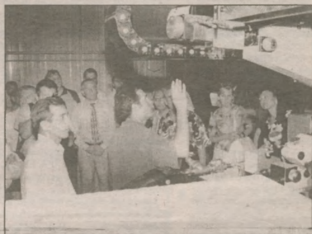
Предприятие "Еврофлекс" готовится к работе. Недавно оно приобрело новейшее итальянское оборудование, на котором будет изготавливать упаковочные материалы для пищевой продукции