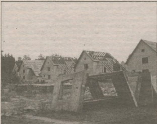
Значительное внимание было уделено городским долго-строям, в частности коттеджной застройке Добрынинского и Черниговского кварталов. Сегодня они оставляют не лучшее впечатление