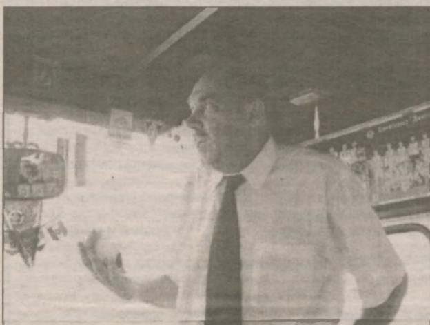
Во время автобусной части экскурсии мэр то и дело указывал на различные городские "негоразды" типа сломанного и невозобновленного дерева, недоасфальтированной дорожки