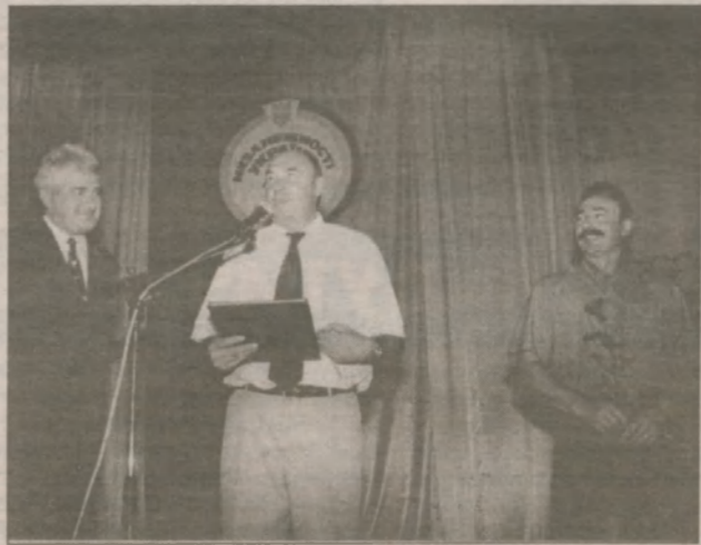
Еще одна презентация ожидается в рамках фестиваля: юным журналистам будет дана пресс-конференция в помещении нового здания горисполкома, сдачи которого в эксплуатацию ожидают и работники горадминистрации, и жители города