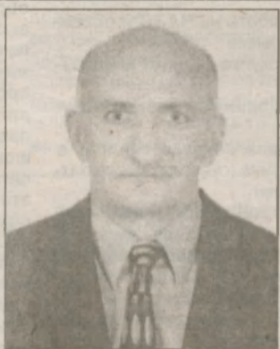
Благотворителей надо знать в лицо