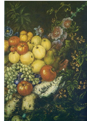
Привіт урожаю. 1946 р.