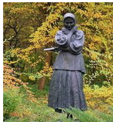
Пам'ятник Катерині Білокур в Яготині