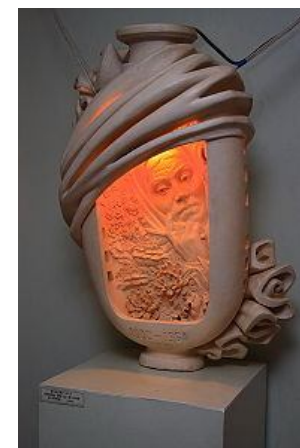
Ювілейна ваза до 90-річчя К. Білокур. Скульптор — Укадер Ю. А., Яготинська картинна галерея