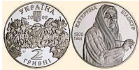
Монета із зображенням Катерини Білокур