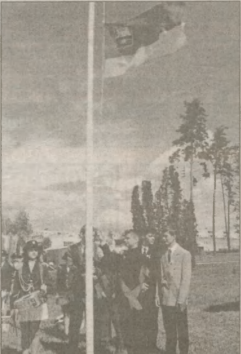
Выпускники славутичских школ 2001 года поднимают флаг города