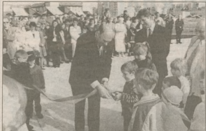
Празднование Дня города началось в 8 часов 15 минут утра — торжественным перерезанием ленты и вручением орденов новоселам дома № 16 Черниговского квартала. Ордера на новое жилье получили 32 славутичские семьи