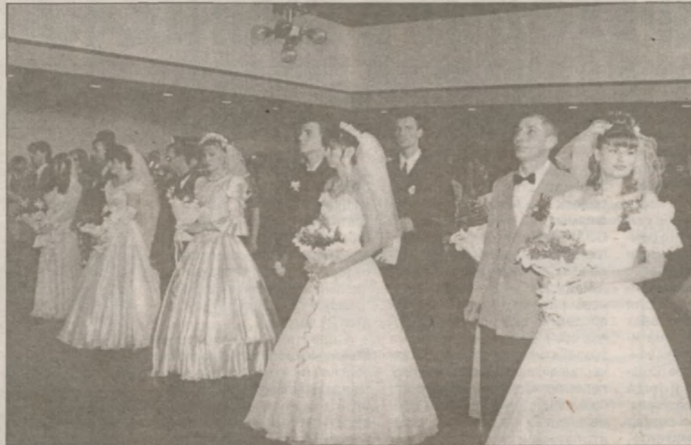
После торжественного митинга, открытого на площади, состоялась первая регистрация бракосочетания в новом зале торжественных событий: сразу пять пар встали на свадебный рушник. Говорят, некрасивых невест не бывает — все невесты были красивы, а женихи серьезные и полны сознания собственной значимости