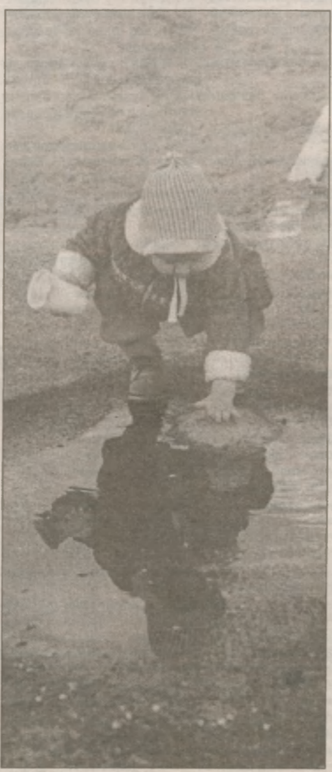
А эта юная славутичанка строит мост. Пока через лужу, но у нее все впереди