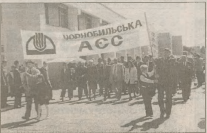
Идет в праздничной колонне коллектив ОП ЧАЭС. За ним — объекта "Укрытие", МСЧ № 5