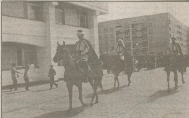
Праздничное шествие (эх, ностальгия по подзабытым уже массовым праздничным демонстрациям!) открыли воспитанники конно-спортивного клуба — в боярских шапках да плащах с эмблемой Славутича. Импровизированный парад "принимали" мэр города, представители администрации ЧАЭС и Киевской облгосадминистрации