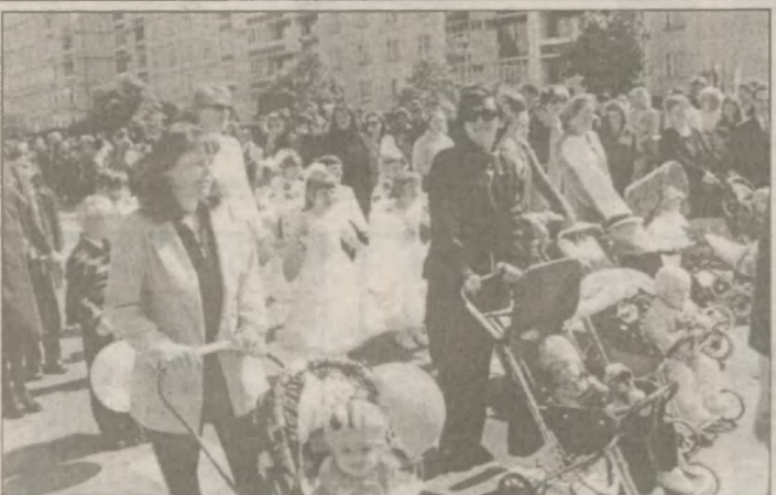
Воистину, Славутич — город детей: самые многочисленные колонны — детские, воспитанников детсадов и учащихся школ. А поглядите, сколько у нас малышей в колясках! Кстати, в самый День города в славутичском роддоме появилась на свет девочка...