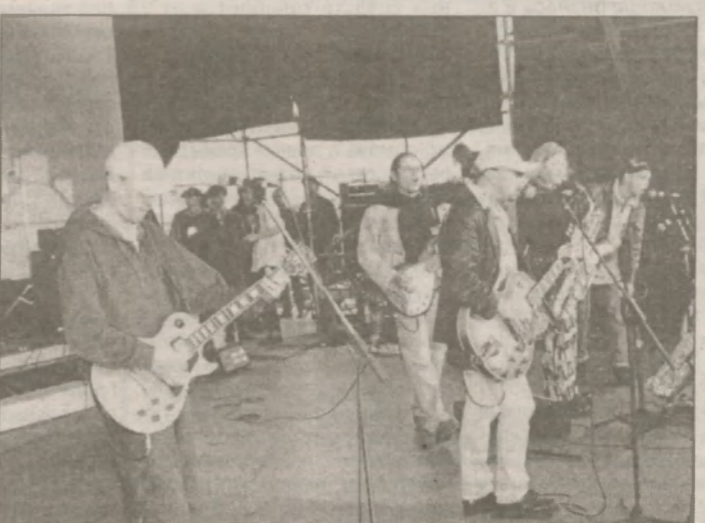
Вечерний концерт. К выступлению готовится Гарик Сукачев и группа "Неприкасаемые". Днём, незадолго до начала концерта, в большом зале кино-концертного комплекса состоялся показ фильма "Праздник", автором которого (постановка, исполнение одной из главных ролей) является Г. Сукачев. После фильма актер ответил на многочисленные вопросы зрителей