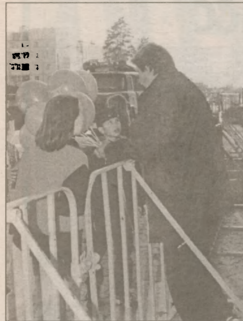
Каждый славутичский ребенок в День города получил пачку мороженого и вдобавок шарик с гербом Славутича и лозунгом праздника