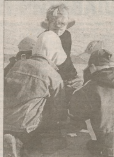
"Выездное заседание казино" в течение часа работало на Центральной площади. Мальчишки азартно играли... прямо под ногами у публики