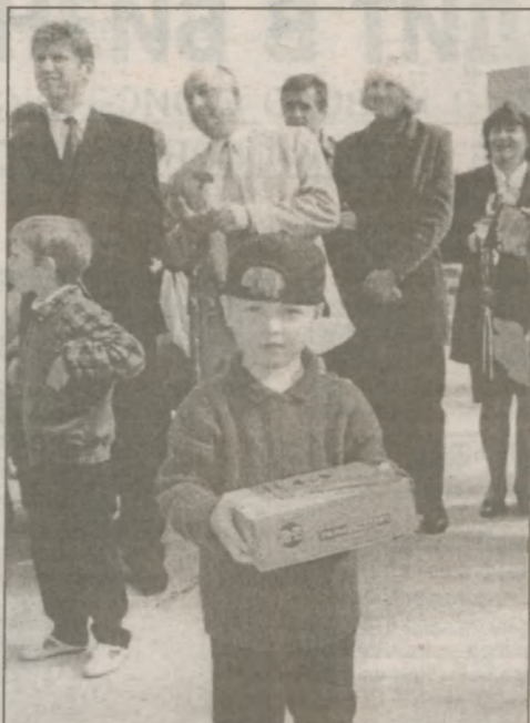
Все новоселы получили подарки от горисполкома: электрочайники, кофеварки, телефоны. Малообеспеченным семьям городской телефонный узел установил телефоны бесплатно