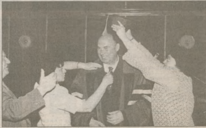
У нашего городского головы теперь уже две мантии: вторую ему вручили от Академии муниципального управления