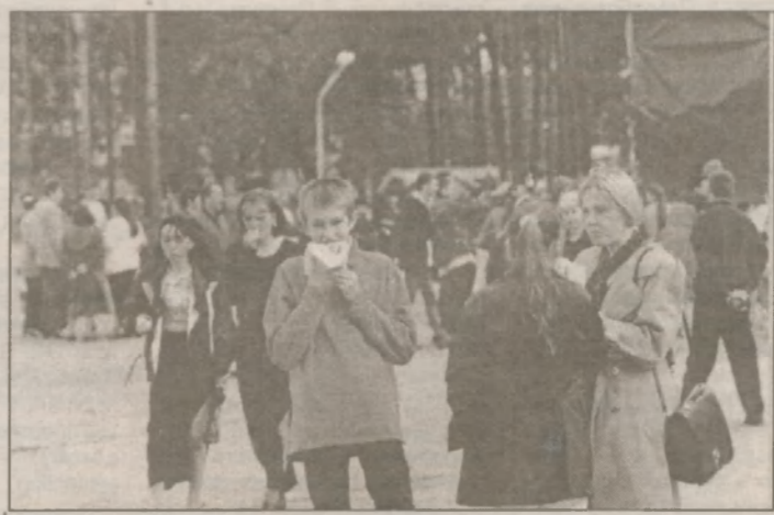
Вечер. Вокруг Центральной площади работают небывало многочисленные кафе и кафешечки. Есть где посидеть, но всегда есть и те, кому приятнее перекусить на ходу...