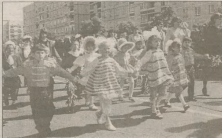
Карнавал — так карнавал: кого только не было в детских колоннах — мушкетеры, моряки, бабочки, куклы. У каждого детского сада — свои лозунги, речевки, приветствия; каждый детский коллектив выгладит самобытно