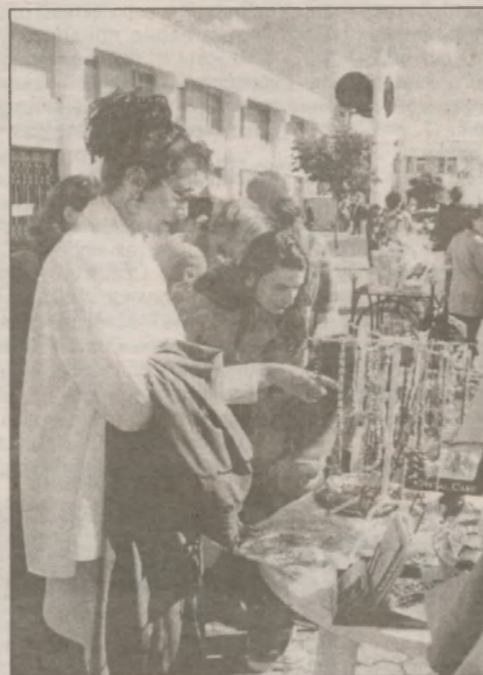
Город мастеров. В его работе приняли участие более двадцати художников, гончаров, мастеров плетения макраме и вязания из Чернигова и Славутича