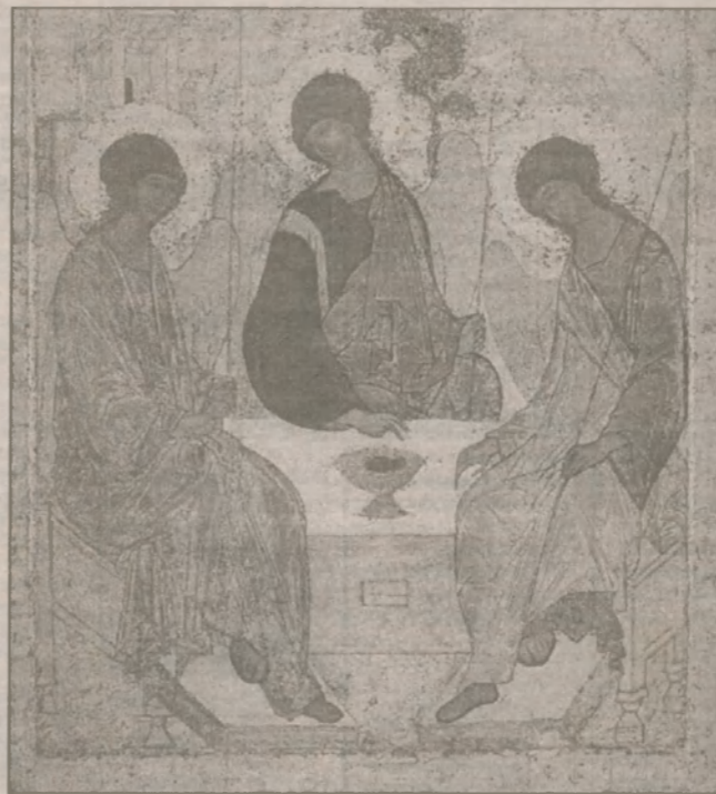
Христа после его Вознесения и заботами о распространении его учения среди всех народов мира.

О Троице сложено множество народных поговорок: «Бог любит Троицу», «Без Троицы дом не строится», «Троица перстов крест кладет». Происхождение праздника Троицы связано с днями