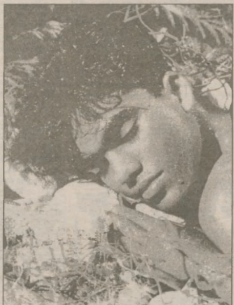
Помните, что душевное и физическое состояние человека, его внешняя привлекательность во многом зависят от того, как он спит.

Давно доказано: хороший, спокойный сон придет к вам, если вы будете спать головой на север.