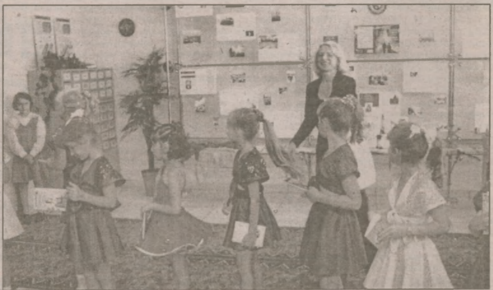
Информационно-библиотечный центр поздравили с открытием юные читатели

Чем принципиально отличается новая библиотечная структура от существовавшей раньше — так это созданием на ее базе информационного центра разви-