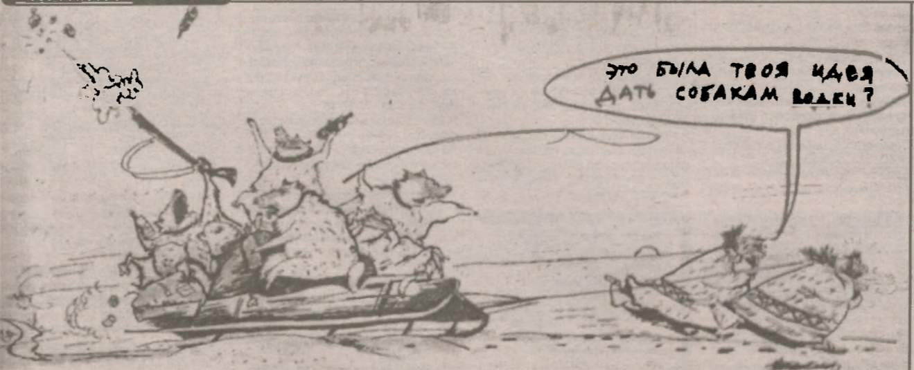
Из жизни «запорожцев»

Стоят «Запорожец» и 600-й «мерс» на перекрестке. Красный свет. Водила «запора» сидит и газует так, как будто собирается стартовать на Луну... Водила «мерса», иронично смотрит на эти потуги, сплевывает жвачку и решает продемонстрировать «класс».