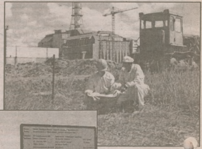
С июня 2000 г. на площадке «малой» стройбазы начались подготовительные работы — срезка растительного слоя грунта, проведение вертикальной планировки с завозкой чистого грунта, ограждение территории с последующим устройством двух КПП — №№1 и 2. В результате бесконкурентного тендера право на проведение подготовительных работ предоставлено КСМП «Украинербуд». Этот этап по графику должен завершиться к 23 августа 2000 г.

предусмотрено проектирование и строительство двух водозаборных скважин, повысительной водопроводной станции, очистных сооружений.