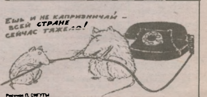
Рисунок П. СМЕТЫ