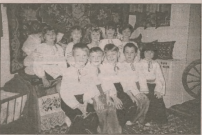
"Чарівні пальчики" (образотворча діяльність), "Грайливі краплинки" (плавання), "Веселі барви" (вишивка, м'яка іграшка)

Всі педагоги нашої дошкільної установи творчі, енергійні, віддані своїй професії люди. Постійно працюють над підвищенням свого професійного рівня, над покращенням якості своєї роботи, шукають нові, нетрадиційні, цікаві форми та методи навчання і виховання дошкільників, сміливо беруть на озброєння нові технології. Широко використовують нова-