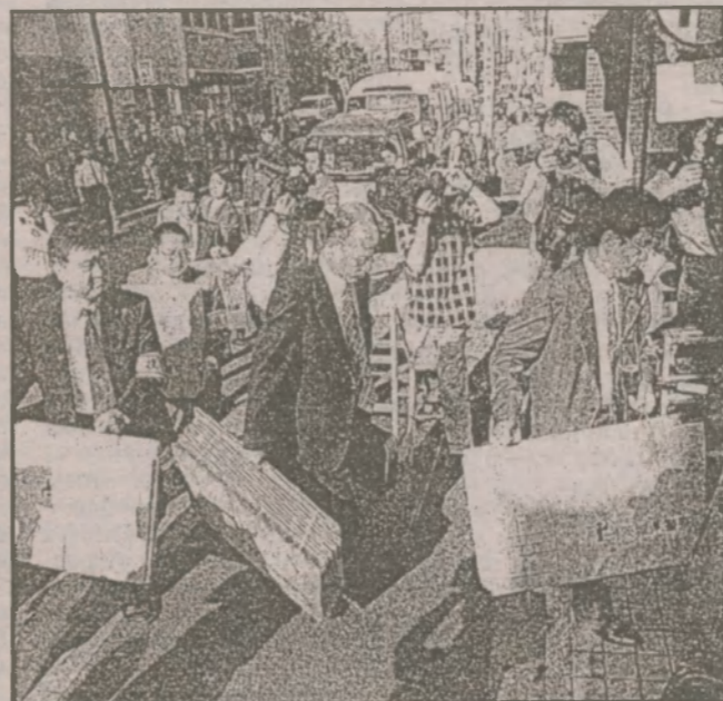
Следователи входят в офис JCO Co в Токио

ренная в установленном порядке ревизия фирмой правительственного руководства по производству уранового топлива и ее ошибки в подготовке и надзоре за рабочими привели к первой для нации аварии, связанной с критичностью.