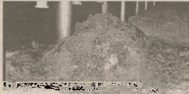
Этот композитный состав на Скопление топливосодержащих масс до и после нанесения ЭКОРа

Первое практико-исследовательское применение уникального органического материала под названием ЭКОР началось в одном из подреакторных помещений Чернобыльского объекта "Укрытие"