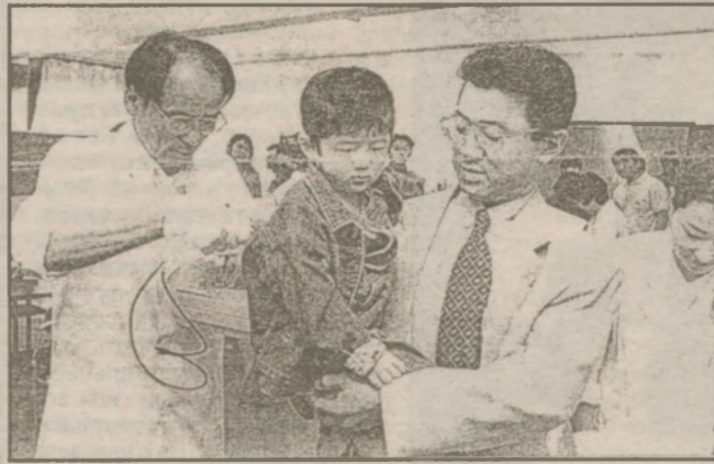
Проверка на предмет радиационного облучения. Госпиталь Красного Креста в Мито