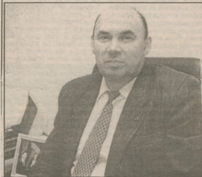
іншого важливого питання.

Це ваше право віддати свій голос 16 квітня 2000 року за утвердження незалежної, демократичної, правової української держави. Для славутичан не найкращі часи його невеликої історії і від того, як ефективно буде діяти влада в Україні, залежить і наше майбутнє. Ми маємо історичний шанс в історії нашої країни впливати на законодавче вирішення того чи