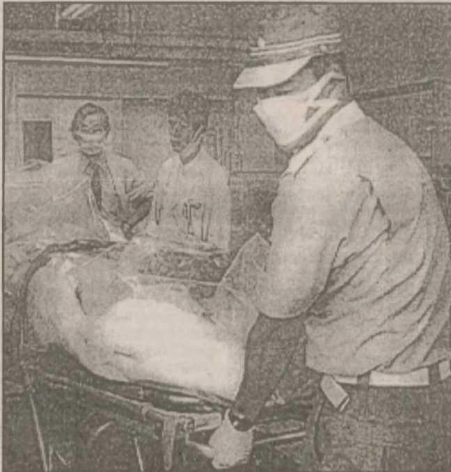
Один из трех пострадавших работников вывозится в специализированный госпиталь в префектуре Чибо

предварительно информированы об утечке радиоактивности в четверг на оборудовании в Токаймура, вместо этого им было сказано, что работники JCO Со. внезапно заболели. Сандружинники вошли в четверг утром на экспериментальную установку JCO по переработке оксида урана с предварительным убеждением, что жертвы страдают от судорог.