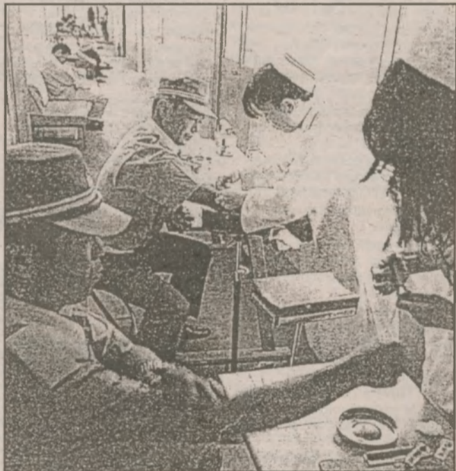
Сандружинники сдают кровь для определения последствий от полученного ими облучения

тотый также подвергся облучению, сообщено, что он испытывает тошноту без проявления других симптомов. Однако, заявили врачи, необходимо продолжать наблюдение за его состоянием.