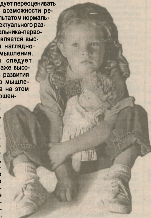
"А я к школе еще не готова..."

Эмоционально-моральный аспект, иначе говоря, душевное здоровье и эмоциональное благополучие является необходимым условием успешности любой деятельности, в т.ч. и обучения. Ребенок с эмоциональными проблемами не способен усваивать знания, уме-