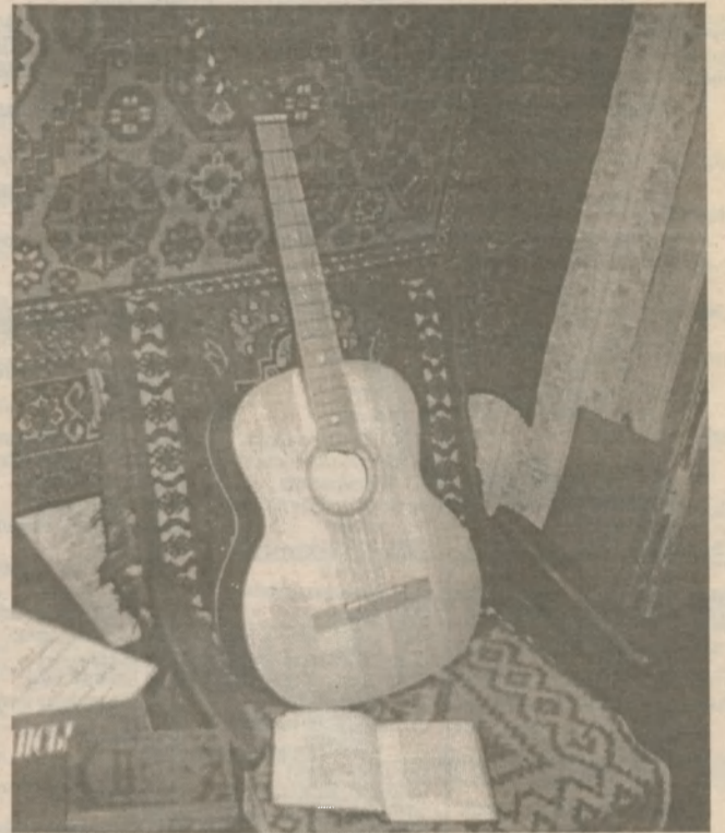
Авторская песня: хорошие стихотворные тексты и гитарный аккомпанемент

сейчас горячие денюшки — поди устрой, организуй, состыкуй все нюансы фестиваля! Их никто не заставляет это делать — наверное, здесь уместны высокие слова о велении сердца, патриотизме по отношению к Славутичу и т.д. и т.п. Впрочем, от высокопарности я воздержусь: хотя — и организуют. Спасибо им