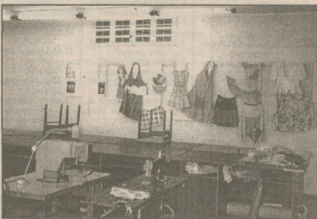
Швейный цех оснащен и бытовыми, и промышленными швейными машинами

... В центре профессионального развития отличная база и для подготовки секретарей-машинисток: у будущих предпринимательниц (кто за офис без секретаря?) профессии есть возможность научиться работать не только на механических и электрических печатных машинах и изучать делопроизводство, но и получить навыки работы на персональном компьютере — таковы веяния времени. В разном объеме получают знания ПЭВМ представители таких специальностей, как оператор