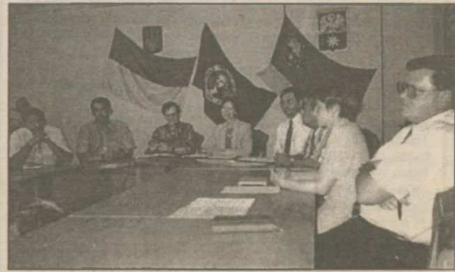
Во время пресс-конференции

Партнерские пары сотрудничают в области определения приоритетных направлений развития их населенных пунктов, разработки планов совместных действий и выполнения на этой основе конкретных социально-экономических проектов, таких как, во-первых, местное экономическое развитие; во-вторых, усовершенствование работы жилищно-коммунального хозяйства и городского транспорта; в-третьих, наполне-