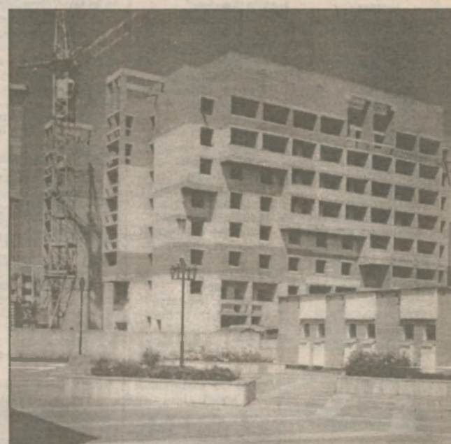
Будь это здание достроено, оно бы Славутич украсило

— Видите ли, несмотря на то, что административно Славутич относится к Киевской области, строился — и построен — он на землях Черниговской области — на границе Черниговского и Репинского районов. Промышленная зона и "пятно" города — за эти границы он