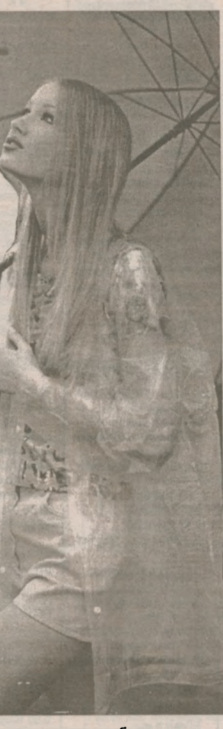
Когда разверзнутся хляби, эдак не подефилируешь

На первом совещании городских служб по этому поводу говорилось, что ливень нанес городскому хозяйству ощутимый урон. Пострадали жилье и объекты социально-культурного назначения. Поступили заявки на ремонт более чем 50 квартир, промоченных дождем. Много воды в подвалах домов. Тщательного изучения требуют проблемы просевшего фундамента в детсаду №7, что в Бакинском квартале. В купели дождевых вод оказались все 110 километров теплотрассы. Произошли в некоторых местах обвалы тротуаров, дорог, газонов... Акты об ущербе составляют компетентными службами города и изучаются в областном штабе по чрезвычайным ситуациям.