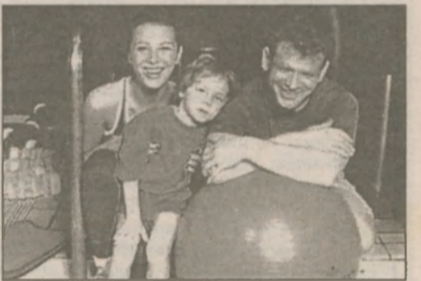
К здоровью — всей семьей

На сегодня банк данных позволяет разрабатывать конкретные целенаправленные мероприятия по оздоровлению населения немедикаментозными средствами на индивидуальном и групповом уровнях. Поэтому "Здоровый город" — это не город, в котором достигнут какой-то особый уровень здоровья, а город, в котором люди всегда помнят и думают о здоровье и стремятся его улучшить. В Славутиче создана достаточно широкая сеть спортивно-оздоровительных учреждений. Практически все дети и подростки посеща-