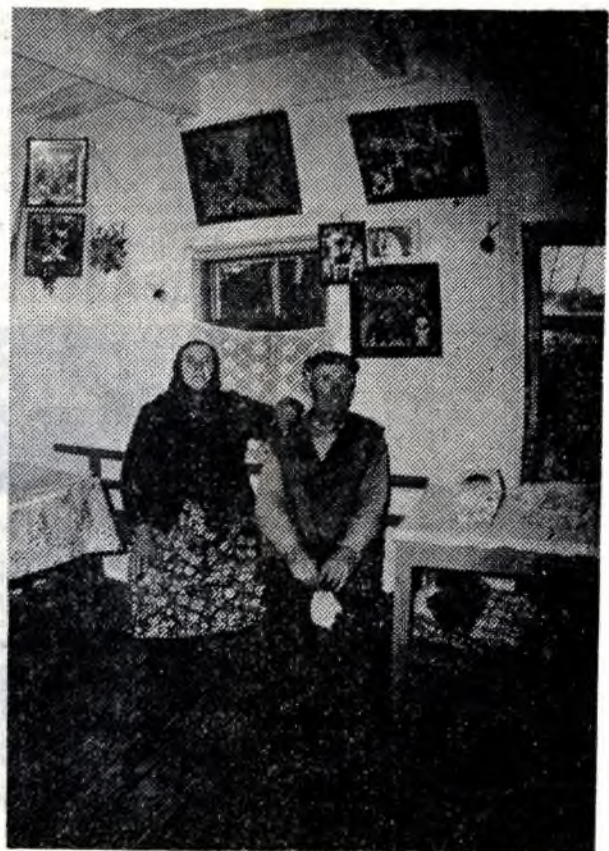
ЛЕТО 1987 ГОДА. В 30-километровую зону стали самовольно возвращаться некоторые жители, эвакуированные из своих сел после аварии на ЧАЭС.