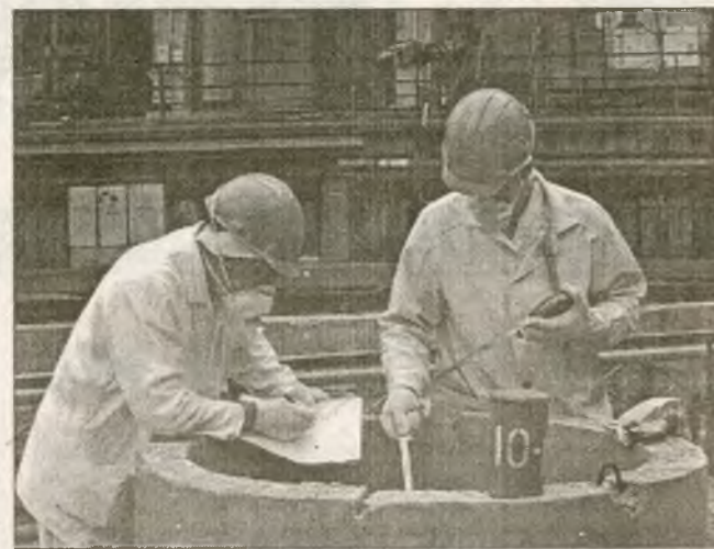
Измерения уровня грунтовых вод в локальной зоне объекта "Укрытие"

— На деаэрационной этажерке у нас занято 36 человек. Эти люди, в основном, жители Славутича, и только несколько человек из окрестных сел, но с опытом работы в зоне отчуждения. Кстати, недавно мы проанализировали данные по кадрам и выяснили, что на постоянной основе у нас трудится 126 человек. Из них только 11 — из Чернигова, Винницы и Киева, остальные — славутичане. В ближайшие два месяца потребность в рабочей силе у нас составит 184 человека. И если успешно пойдут дела, то трудовые ресурсы с каж-