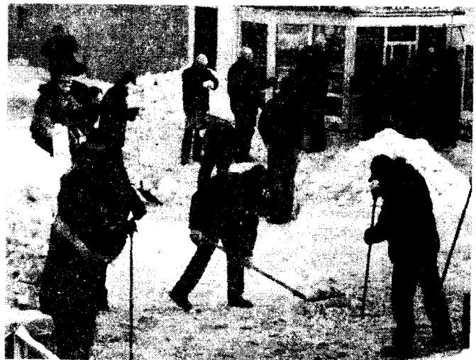
«Снежный» субботник работников ЧАЭС

Надо отметить, что несмотря на имеющиеся проблемы, ситуация с расчисткой дорог и тротуаров в Славутиче куда более благоприятна, чем в других городах Украины. Те, кто часто бывают в Чернигове и Киеве, могут в этом убедиться лично. И хотя на сегодняшний день по соотно-