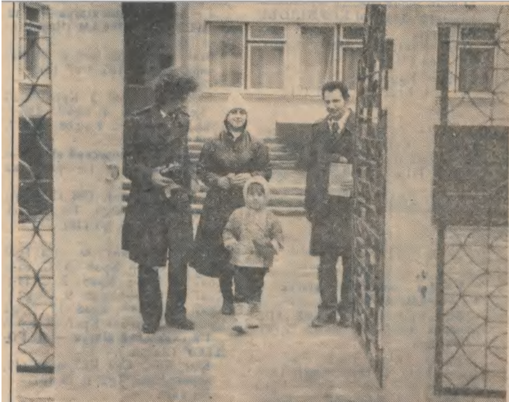
На фото (слева—направо):