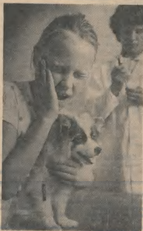
● Каким быть Славутичу, есть ли у него будущее? Есть! Ибо сам город и его жители очень молоды.