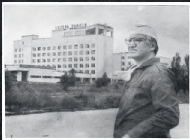
Мертве місто Прип'ять (липень, 1995 р.), тридцятикілометрова зона відчуження

Куратор ООН з гуманітарних питань Грегори Хартл оглядає мертве місто Прип'ять (5 липня 1995 р.)