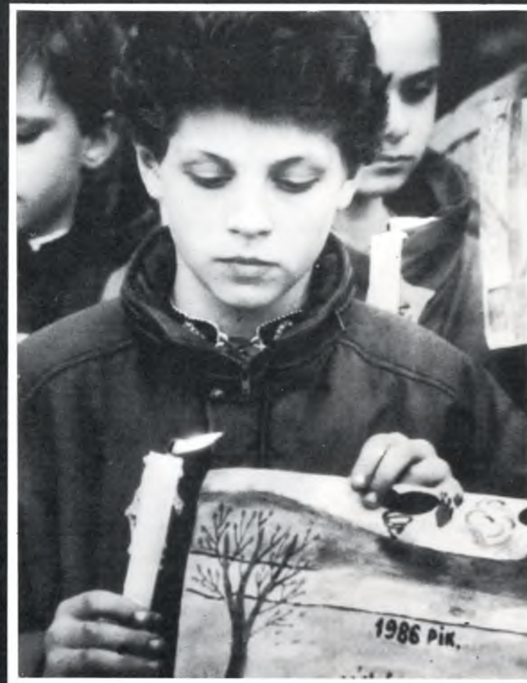
Серія «Діти Чорнобиля»

Радіоактивного занечищення зазнали величезні території. Значного забруднення зазнали водні джерела, особливо річки, що протікають неподалік ЧАЕС, і Київське водосховище, а також водозбірні площі басейнів рік Дніпро та Прип'ять