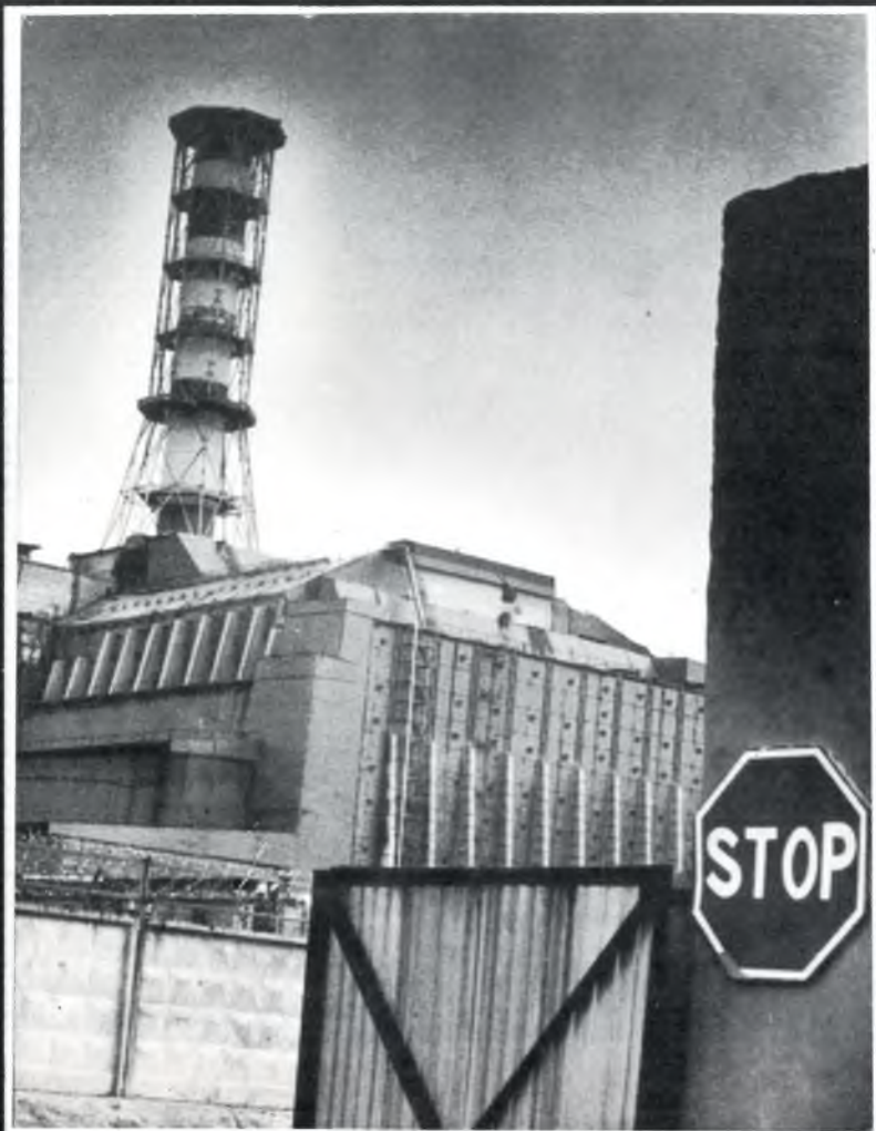
Біля оглядового майданчика ЧАЕС (1995 р.)