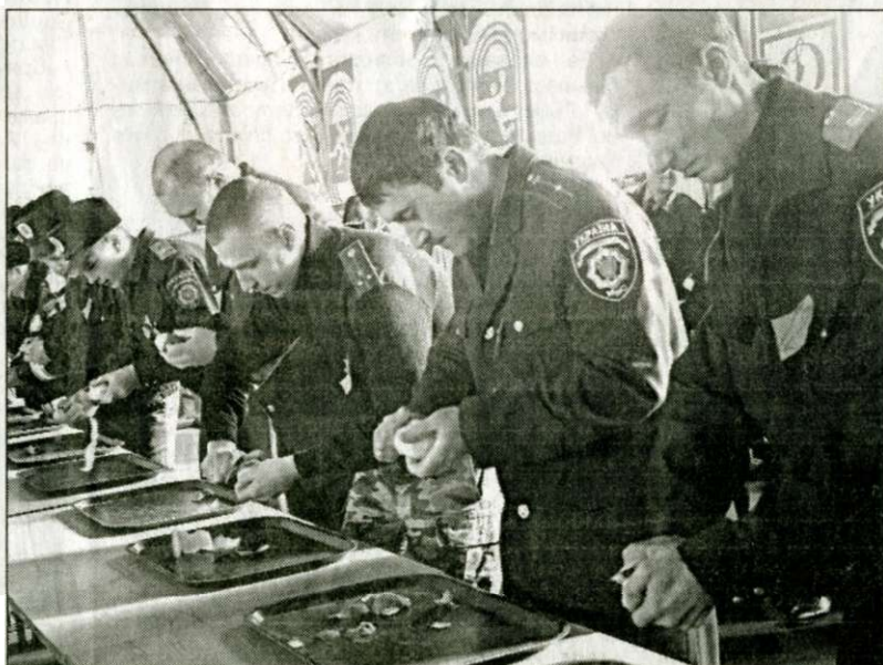
• у чищенні картоплі теж треба показати своє вміння.