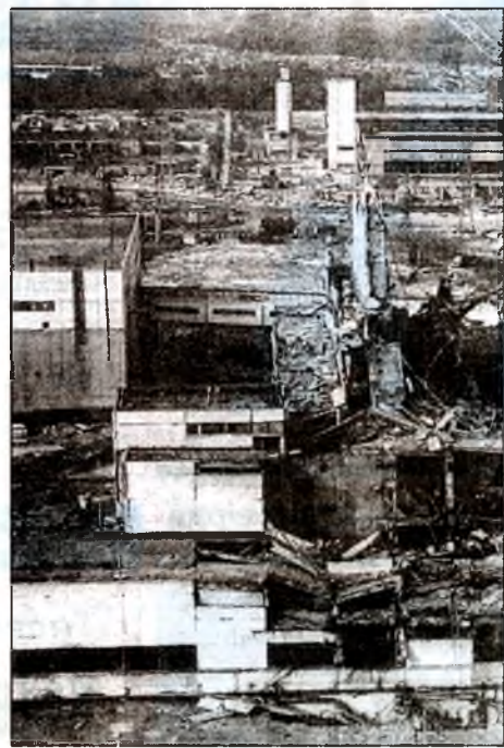
● Так виглядав зруйнований сумнозвісний четвертий блок атомної одразу після аварії. Знімок зроблений 28 квітня 1986 року.

Не легші враження і від поїздки по самій зоні. З колішніх дуже гарних сіл з білими хатами, з садочками, з осінніми жоржинами та чорнобривцями тепер залишились тільки руїни, знову ті ж порожні очі вікон. На кладовищах погнили та похилилися дерев'яні хрести.