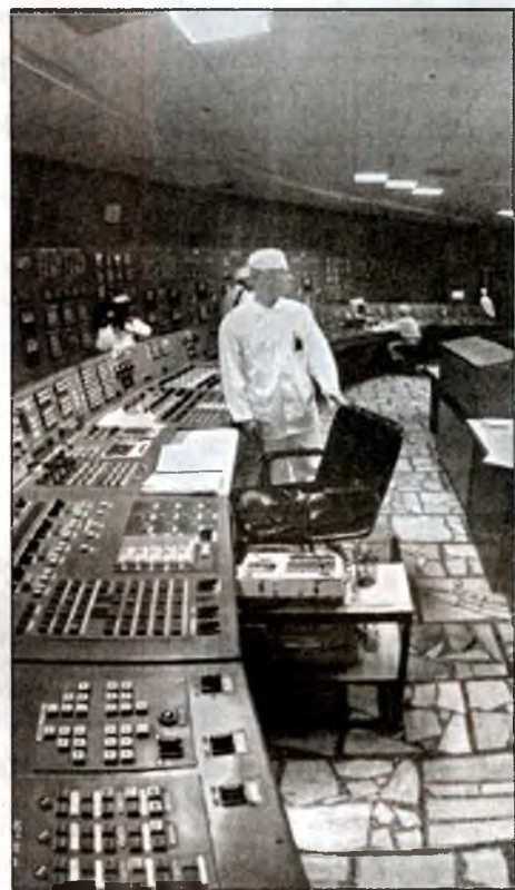
● До остаточного закриття станції 15 грудня 2000 року залишились хвилини...

Коли якась делегація їде до зони, то всі жваво розмовляють, обговорюють те, що можуть побачити, де б хотіли побувати. На зворотному шляху в автобусі — мовчання. Кожний по-своєму переживає побачене, не може усвідомити жорстоку правду, що цей армагедон трапився на нашій землі. На такій маленькій землі, де і Київ, і Лондон, здається, зовсім поряд, якщо летіти літаком. На тій землі, де квітуча місцевість, буквально за кілька днів була перетворена у суцільну пустку, де за 23 роки не людьми, не бомбами, а тільки атомом, тільки часом, тільки вітрами було зруйновано все, що можна зруйнувати.