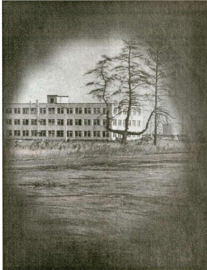
• Сосна, обпалена жаром зруйнованого четвертого реактора тієї незабутньої ночі 26 квітня 1986 року.

У новому тисячолітті індустрія туризму стане однією з розвинутих у світі по кількості отриманого прибутку і людей, зайнятих у цьому бізнесі. Туризм сприяє швидкому розвитку великої кількості малих підприємств, причому настільки швидкому, що з