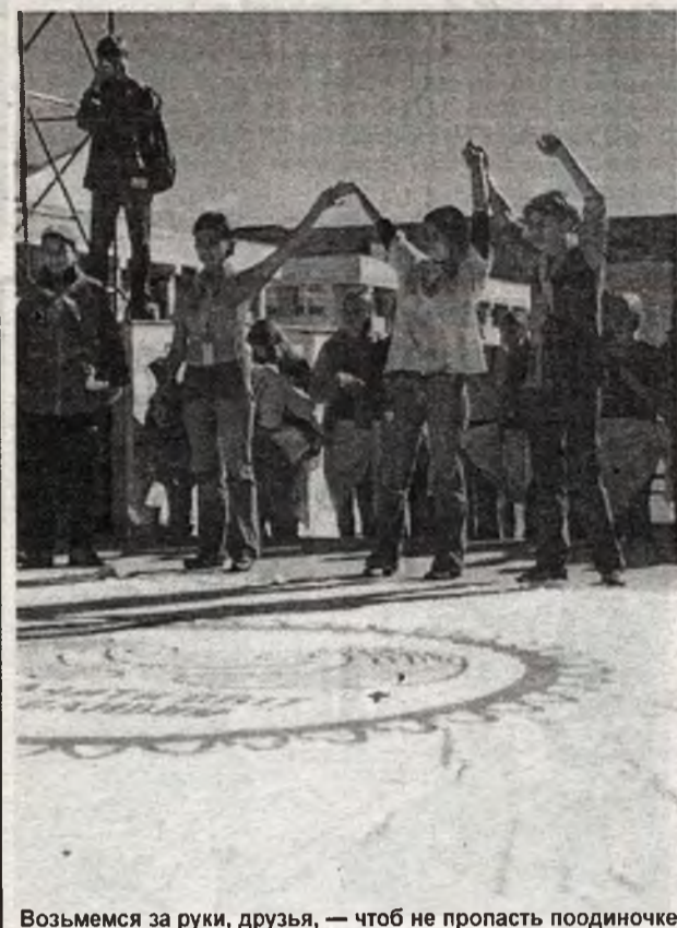
Возьмемся за руки, друзья, — чтоб не пропасть поодиночке