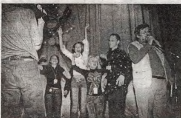
Награждение причастных, заслуженных и отличившихся