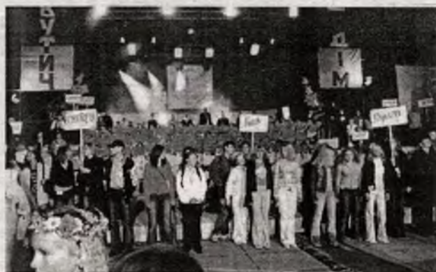
Открытие фестиваля. Все баталии, огорчения и победы еще впереди