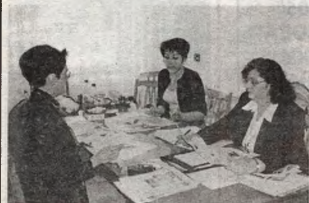
Жюри работало очень дружно: оценки, выставленные тремя разными журналистами, практически не отличались. Зато победителей среди многочисленных претендентов выделить было не просто