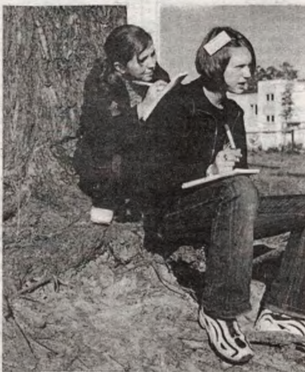
Тексты для конкурсных газет зачастую создавались в военно-полевых условиях