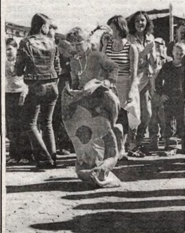
Массовики-затейники из ДДТ практически целый день играли с детишками на площади