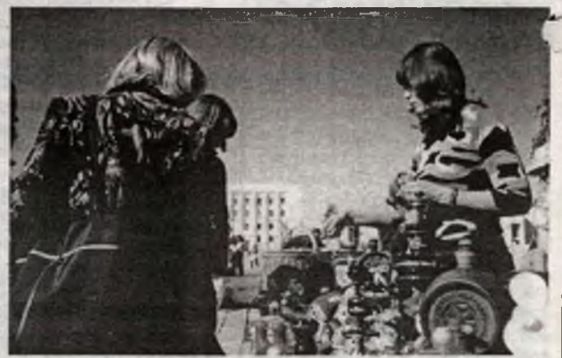
Город мастеров. Ехать с феста и не купить славутичский сувенир?!