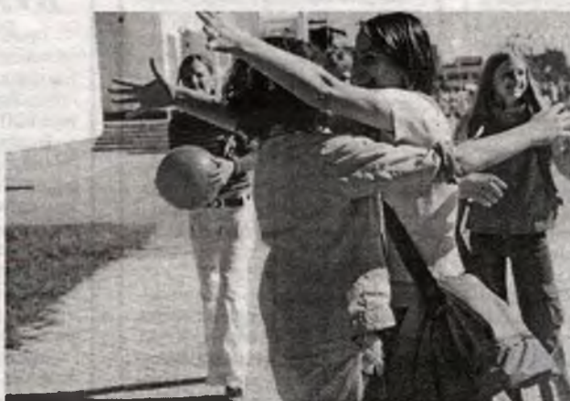
Встречались так, словно не виделись лет сто...