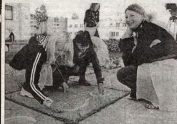
Каждый развлекался как мог — в свободное от основного развлечения время