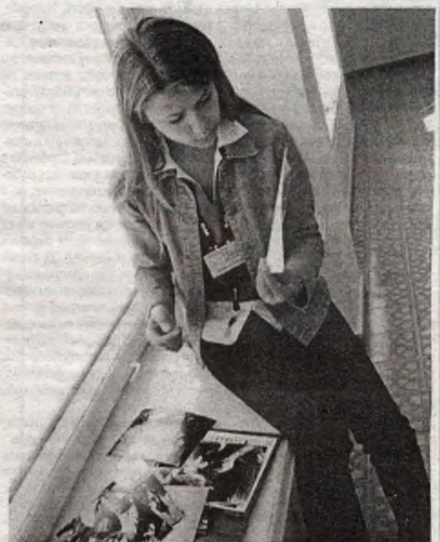
Команда "МИГ" — работала на всех доступных подоконниках ДДТ и прочих зданий города