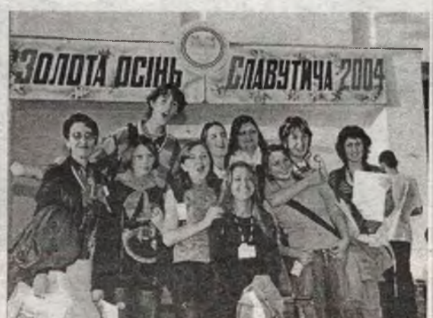
Славутичский "Стоп-кадр" так сдружился с "Перекрестком", что не хотел расставаться и после феста