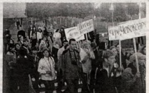
Торжественное шествие. Славутичанам почему-то "не хватило" таблички с надписью "Славутич"