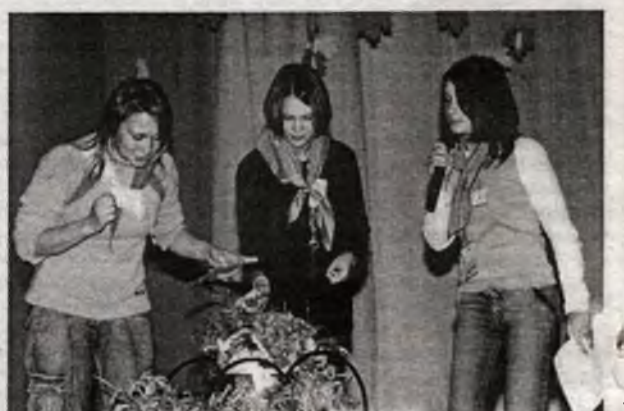
Жеребьевка. "Выбери меня, выбери меня, птица счастья завтрашнего дня"