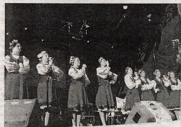
Днем — репетировали. Вечером — выступали. Сцена фестиваля не "гуляла" ни часа