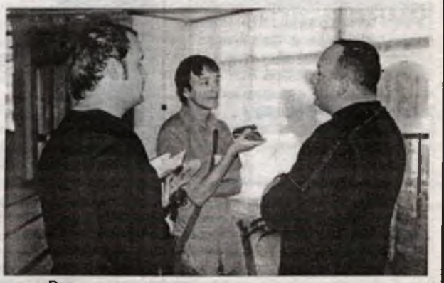
В совершенно потрясающих по качеству и идее фестивальных блокнотах были номера всех служб и лиц, которые могли дать начжуром сведения о городе. "Детки" информацией воспользовались и повели "контактных лиц" везде, где могли