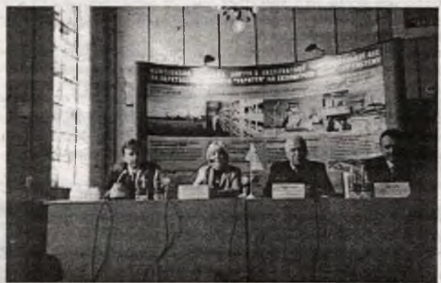
Пресс-конференция руководства станции почему-то не собрала обычного количества юных журналистов. Может, потому, что не предусматривались спецпризы за раскрытие спецтема?