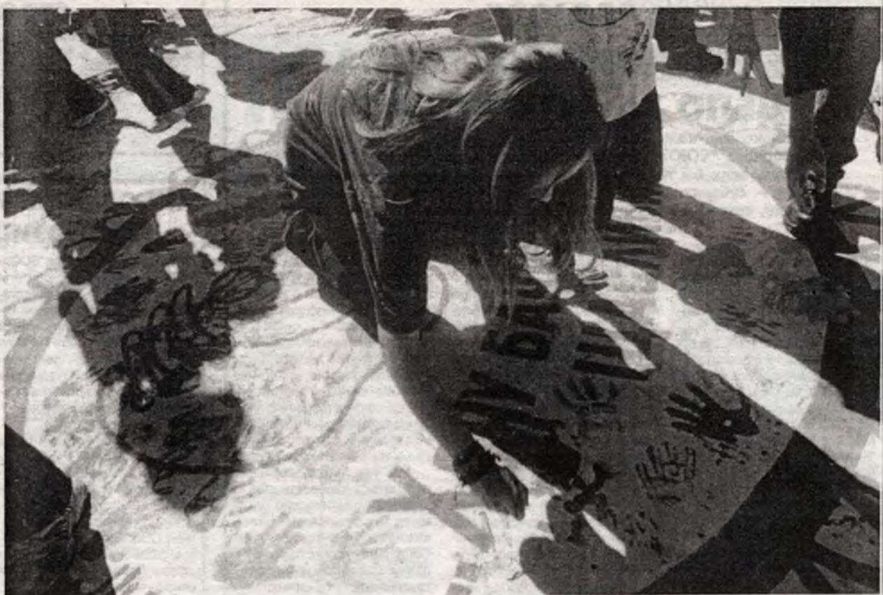
Братание. Приличная его часть. Краской еще не облит никто