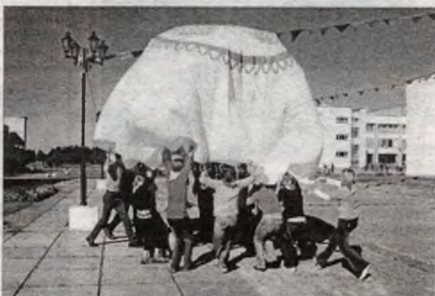
Через несколько минут на этом замечательном полотнище появятся отпечатки рук и ног побратавшихся фестивальщиков...