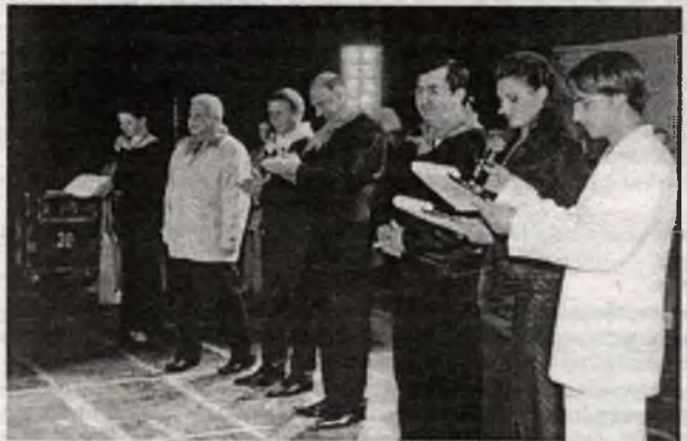
Открытие фестиваля. Участников приветствовала администрация города, директорат ведущих предприятий