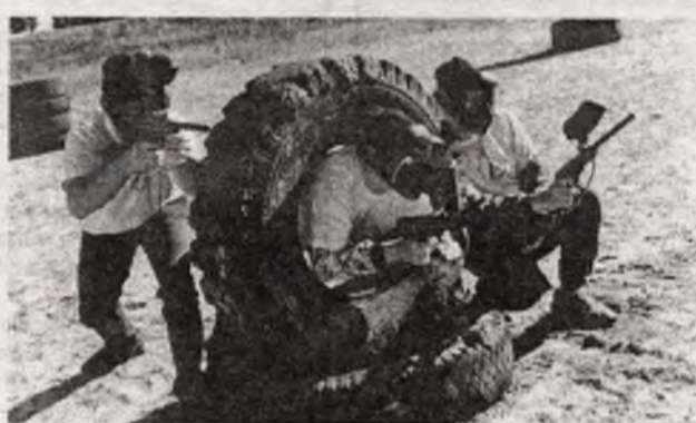
Ребята из славутичской УСДМ предложили свой вариант досуга — пострелять из пистолета шариками с краской. В течение двух с лишним часов у них "отстреливались" все желающие