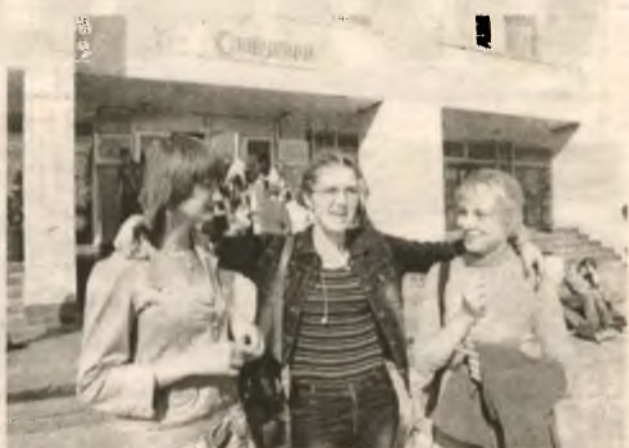
Встреча бывалых фестивальщиков, регистрация конкурсантов и их поселение — шоу не из последних

Третье место в номинации «Пресса» досталось команде из Чебоксар (впрочем, географическая принадлежность названа чисто условно, поскольку уже в финале выяснилось, что в команде собраны ребята из разных городов России. Как