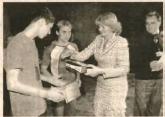
Награждение победителей и причастных. На «малой сцене фестиваля» (в киноконцертном комплексе) награждали лауреатов, дипломантов и те команды, кто завоевал 2 — 3 места.