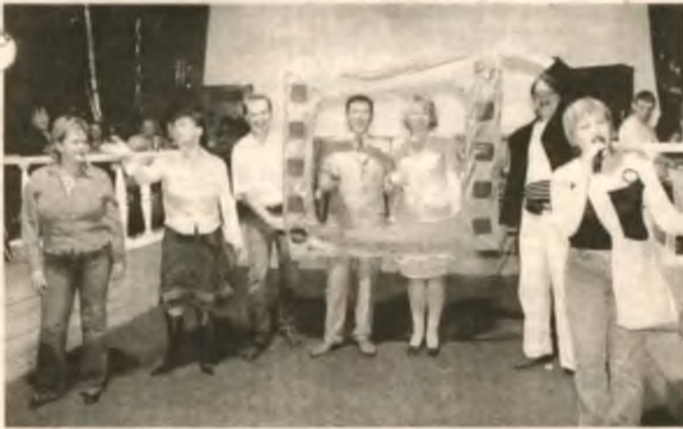
В фестивальную субботу отметил десятилетие ДДТ. Его пришли поздравить пионеры из гороо и вся пресса Украины