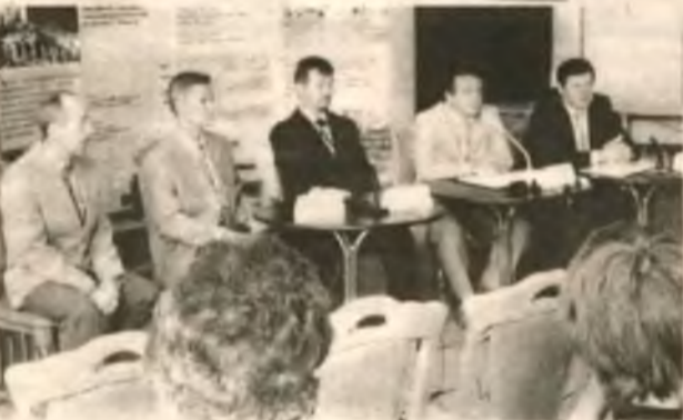
Пресс-конференция руководителей ГСП ЧАЭС и «АтомРемонтСервиса» собрала более трех десятков журналистов всех возрастов