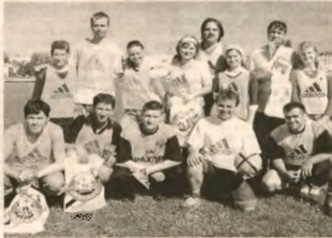
Впервые на «ЗОСе», по инициативе и при спонсорстве донецкого «Шахтера», состоялся футбольный матч между командами молодых и зрелых журналистов. Победили ветераны