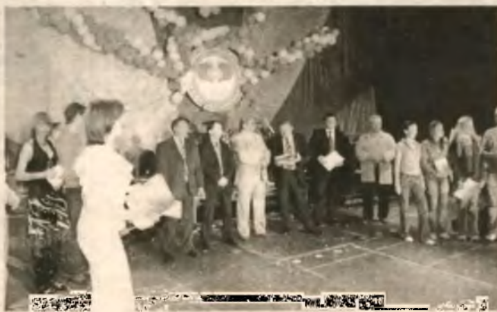
Славутич вместе с участниками фестиваля отметил десятилетие НАЭК «Энергоатом»