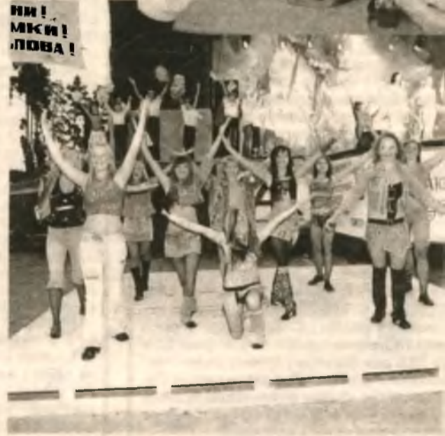
На большой фестивальной сцене шли концерты...