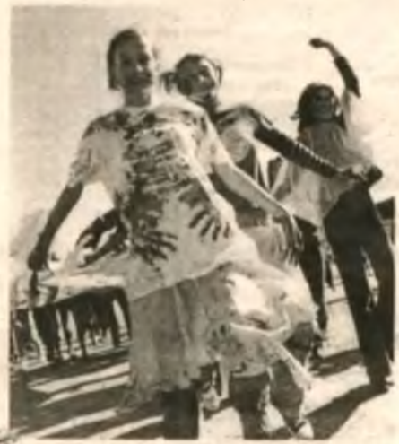
"Какое было братание! Мы едва отмылись..." — написали в одной конкурсной газете. Комментарии излишни