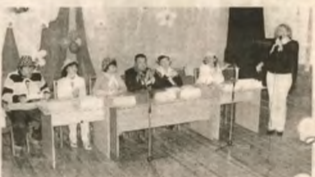
Установочная пресс-конференция прошла под девизом: «Меньше текста, уважаемые ораторы!» В результате, до традиционного шествия все успели поужинать, что на «ЗОСе» бывает не часто