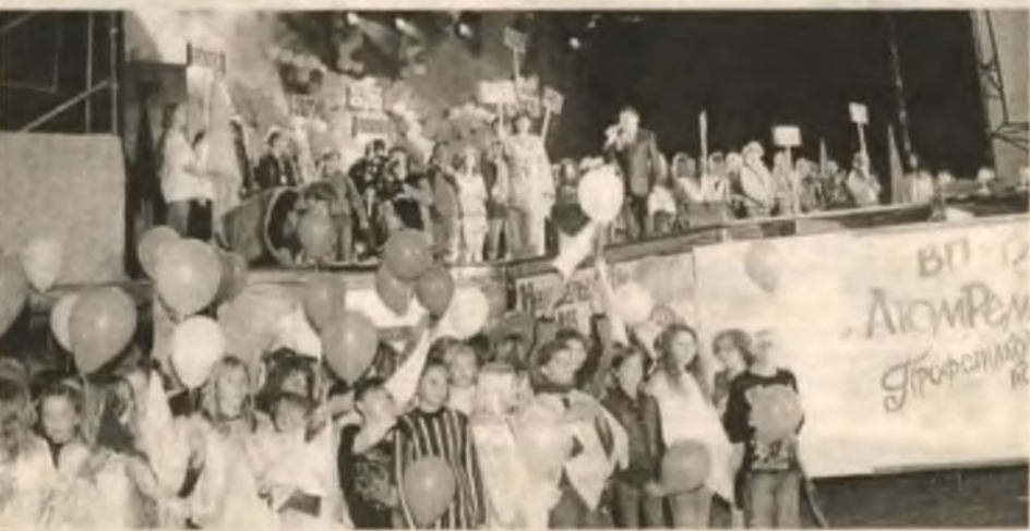
Фестивальный аттракцион: потусоваться на сцене под бдительным оком теле- и фотокамер

Но фестиваль — это не только изнурительная работа юных журналистов. Он наполнен множеством других событий. О них — в нашем фоторепортаже.