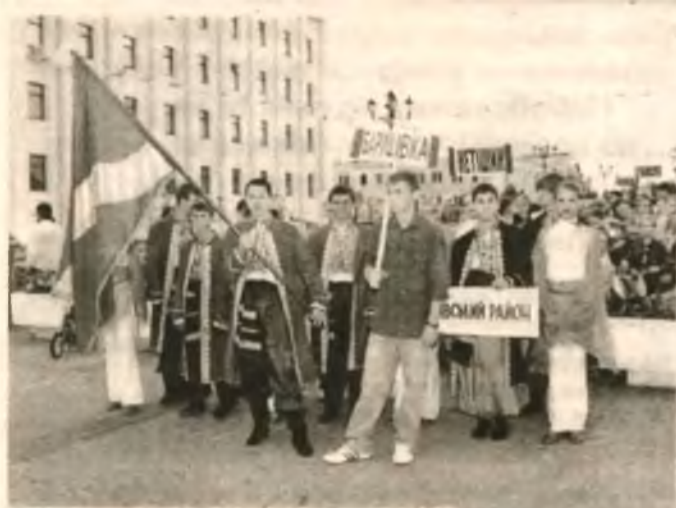
Ах, какое было дружное шествие! И короткое, опять же: шли не через весь город, а от ДДТ до сцены. И это тоже было хорошо